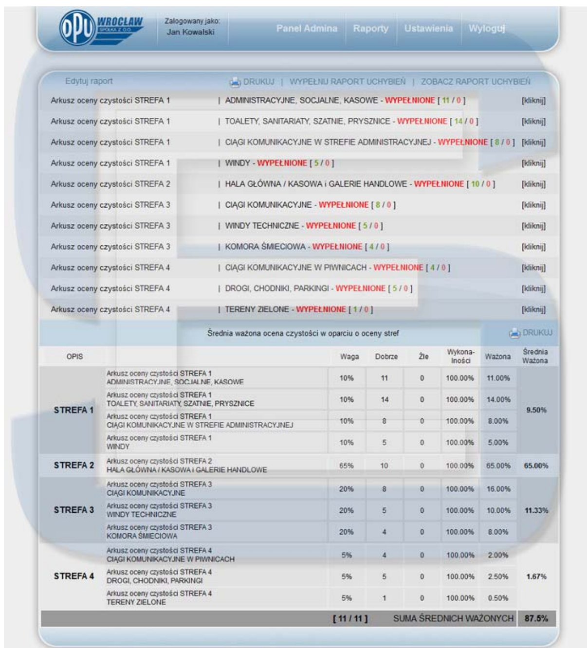
Rys. 2. Podsumowanie raportu czystości stref.

Na rysunku numer 1 przedstawiono sposób wypełniania raportów poszczególnych stref.